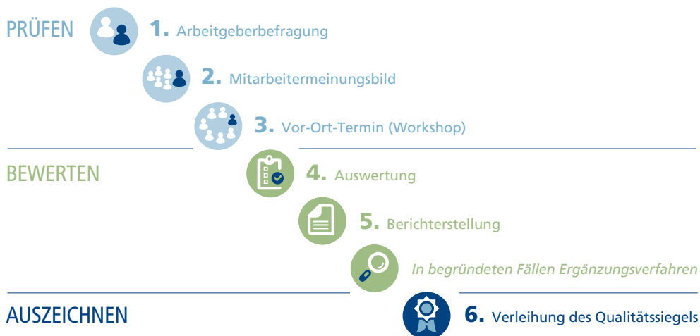
Abbildung: Ablauf des Prüfverfahrens